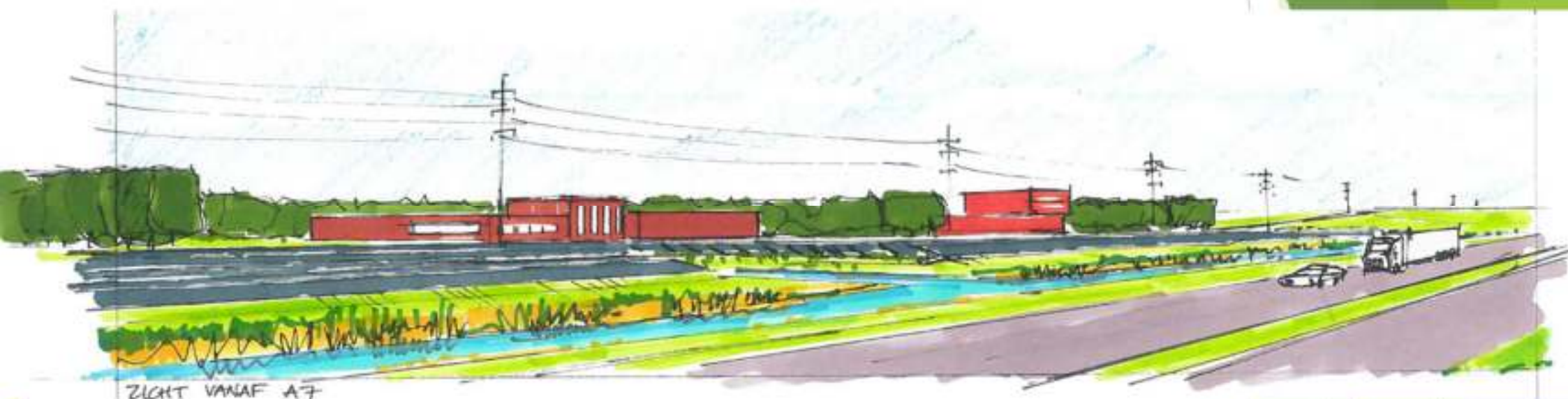
ZICHT VANAF A7