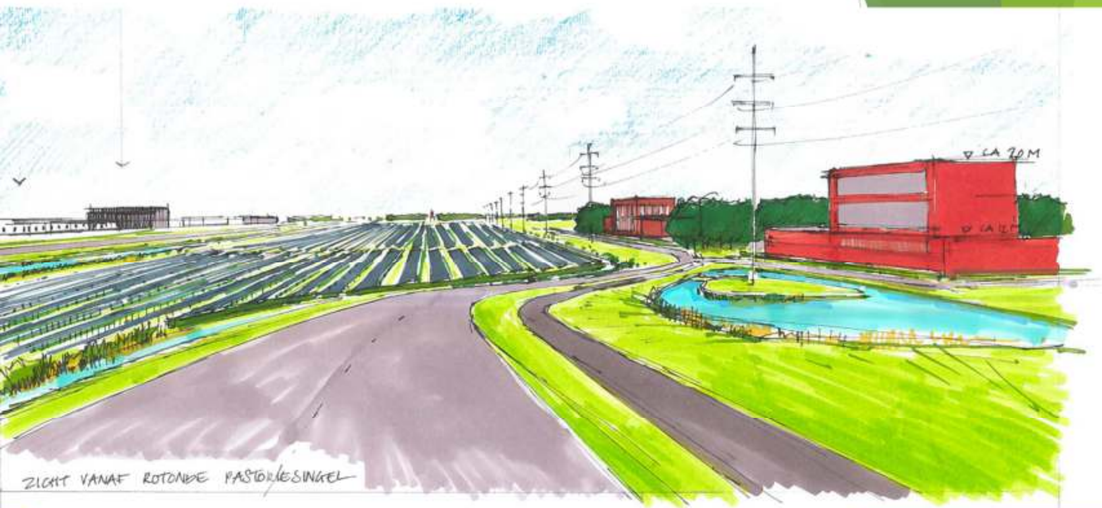
ZICHT VANAF ROTONDE PASTORLESINGEL